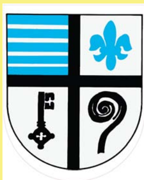
Wappen der ehemaligen Gemeinde Vorst

Diese kostspielige Aktion war nur möglich durch eine großzügige Unterstützung aus der Sparkassen-Stiftung. Der Heimatverein hat in Vertretung der Vorster Vereine den entsprechenden Antrag gestellt. Dazu kam dann noch eine großzügige Spende der örtlichen Sparkassenfiliale. Ein herzlicher Dank geht an die oben genannten Sponsoren. Mit dem Aufstellen des Maibaums am Samstag, dem 6. Mai 2017, wurden diese der Öffentlichkeit präsentiert. Hier nun die einzelnen Wappen, die am Maibaum präsentiert werden (Autor: Heinrich Stieger):