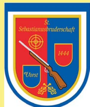
St. Sebastianus Schützenbruderschaft