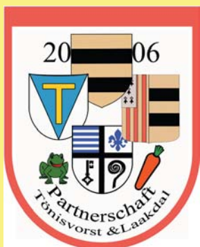
Partnerschaft Tönisvorst & Laakdal