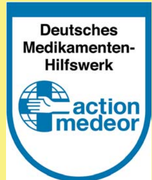
Medikamentenhilfswerk action medeor