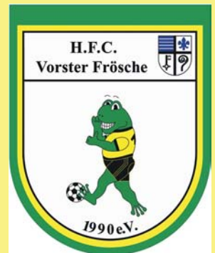
H.F.C. Vorster Frösche 1990 e.V.