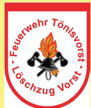
Freiw. Feuerwehr Tönisvorst Löschzug Vorst