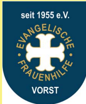
Evangelische Frauenhilfe Vorst