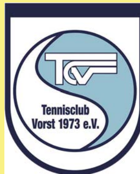
Tennisclub Vorst 1973 e.V.