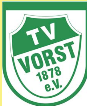
Turnverein Vorst 1878 e.V.