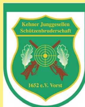
Kehner Junggesellen Schützenbruderschaft