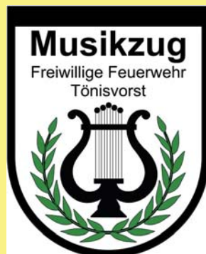
Musikzug der Freiw. Feuerwehr Tönisvorst