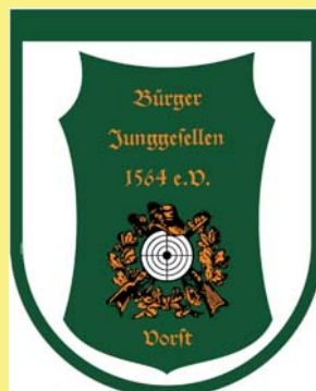
Bürger Junggesellen Schützenbruderschaft