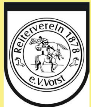
Reitverein 1878 e.V. Vorst