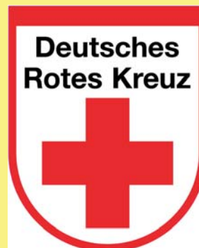
Deutsches Rotes Kreuz Ortsverein Vorst