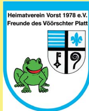
Heimatverein Vorst 1978 e.V.