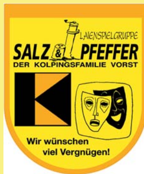
Laienspielgruppe „Salz & Pfeffer“