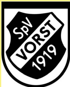
Spielverein Vorst 1919